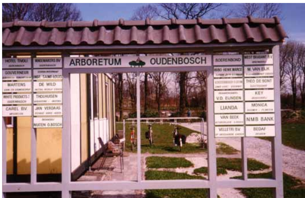
1988 info-bord met sponsornamen.

Wat heeft u bezield om dit project aan te gaan? Had u naast dit vrijwilligerswerk nog een gewone baan?