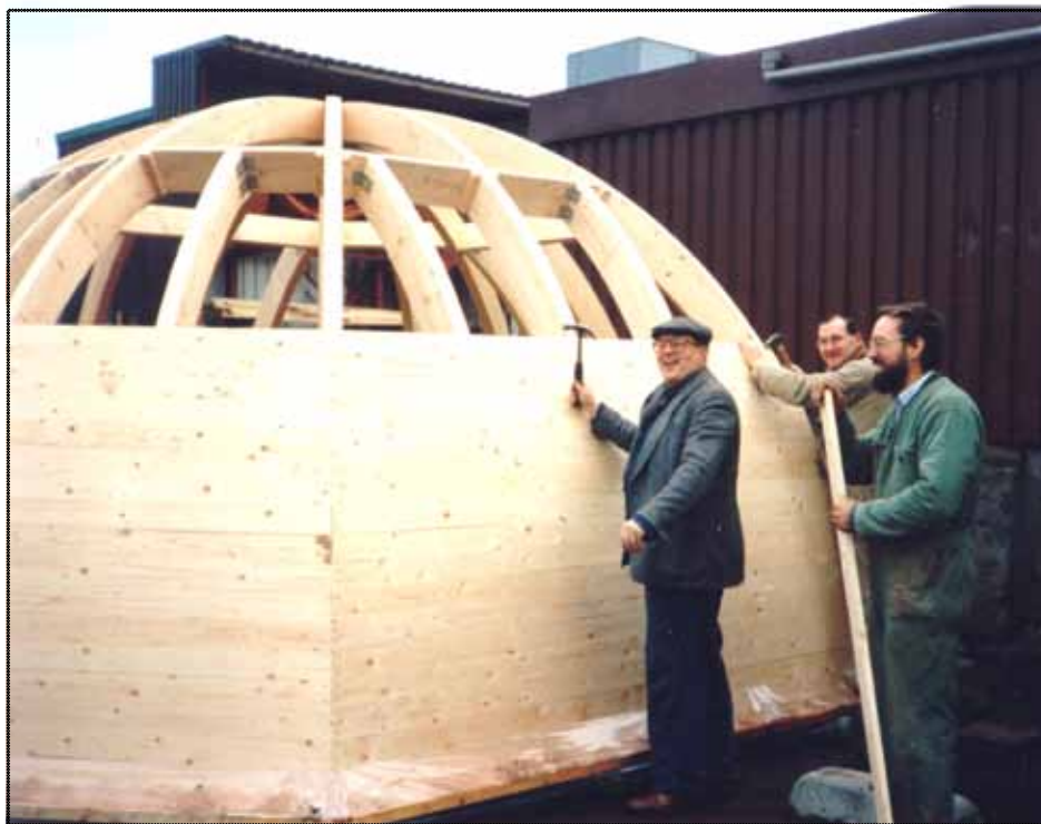
Bouw van de theekoepel.