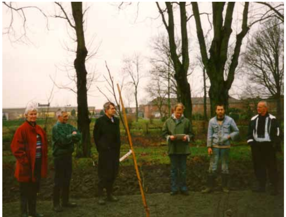
1988 Boomplanting bomenfonds.

Het geld werd in het begin vooral gehaald uit sponsorgelden. Of-schoon de sponsoring met kleine bedragen ging, nam de opbrengst door de grote animo onder bedrijven en particulieren snel toe. In 1987 begonnen we met bijna fl. 5.000,- aan sponsorgeld, dat in 1988 al was verdubbeld. Ik ging gewoon bedrijven af. Deels bij bekende, maar ook gewoon bij mij niet bekende bedrijven. Later - toen wij ook de paden gingen aanbieden aan sponsors - werden de bedragen groter. Het waren voor die tijd redelijk hoge bedragen. In 1992 bereikte de sponsorbijdrage met ruim fl. 9.600,- zijn top. Mede door deze financiële steun slaagden wij er snel in de toegezegde fl. 60.000,- bijeen te krijgen.