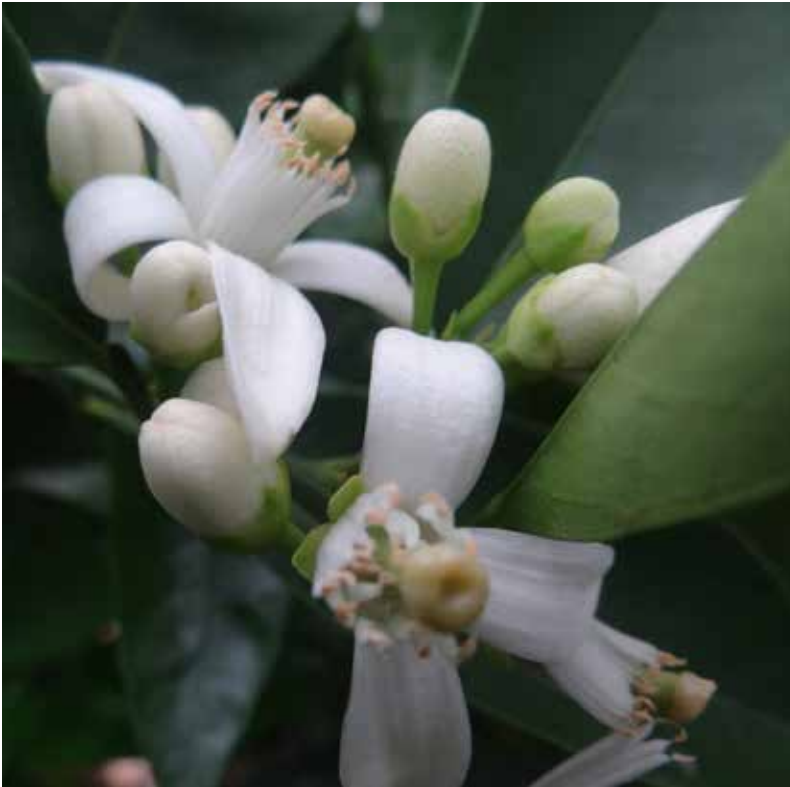
Arboretum Oudebosch, maart 2014, Oranjeboom met bloemen en appels, rijp en groen.