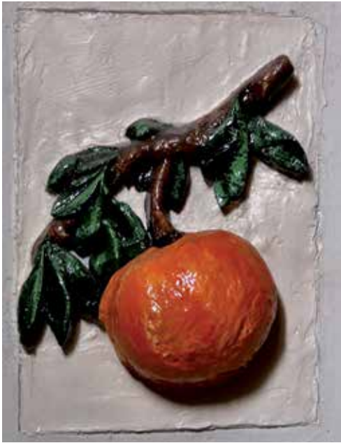
Steenje in binnenmuur Doopsgezinde Kerk, Singel 453, Amsterdam*. Afkomstig van voormalige Doopsgezinde Weeshuis 'De Oranjeappel'

..... "Met kunst gevlochten Haegh, besproeyt van Vyverstroom, Die kiesch, de wortels leckt van den Oranjeboom; Oranjeboom, die ciert de Tempe van ons' landen; Boom, naer wiens geur en sap 's volcx monden watertanden" ..... (Geboortklock van Willem van Nassau, 1626 2 )