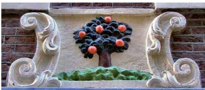
Gevelsteen, Stooftsteeg 8, Amsterdam 4

In een aantal artikelen beschrijf ik de oranjeboomen uit verleden en heden. De vorige aflevering ging in op de plantkundige oranjeboom. In deze aflevering vertel ik hoe die boom en zijn vruchten vanaf de tachtigjarige oorlog tot de instelling van ons koninkrijk werden gebruikt als propagandamiddel voor en tegen de Oranjes.