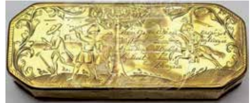
Tabaksdoos, 1787, met gravure van Patriotten die de Oranjeboom wilden vellen en verjaagd worden 8 .

Het is een van de vele voorbeelden waarin de Oranjeboom als symbool werd ingezet. Beide partijen gebruikten die, in pamfletten en liederen, en in spotprenten op papier, op tabaksdozen en al wat zich verder laat graveren of beschilderen.