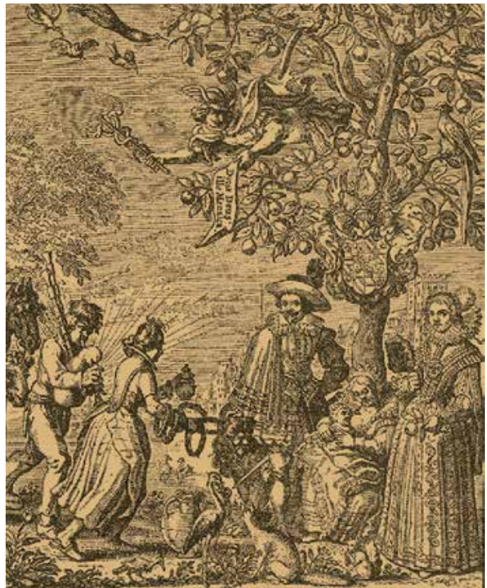
Illustratie bij het lofdicht van Vondel 1

's Gravenhage den 20 Maert [...] De Schutters van 't Oranje Vendel [...] zullen [...] alhier, dit jaar de Mayboomen volgens jaarlijkse gewoonte planten [...]. Voor ZIJN HOOGH. DEN JONGEN ERF-PRINCE: Een Kind met een Oranje-appel in de hand [...]. (Amsterdamse Courant, 22-03-1749).