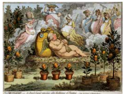
Stadhouder Willem V tussen zijn oranjebomen 9

Een nabloeier is de afbeelding van een vadsige Stadhouder Willem V, die als een dronken Cupido op zijn goedgevulde geldzak ligt, omringd door kennelijk door hem bezwangerde vrouwen temidden van een collectie Oranjeboomen met vruchten die zijn buitenechtelijke kinderen voorstellen. Dit is trouwens een Engelse spotprent uit 1796. Ook in ballingschap was er blijkbaar nogal wat commentaar op zijn levenswijze.