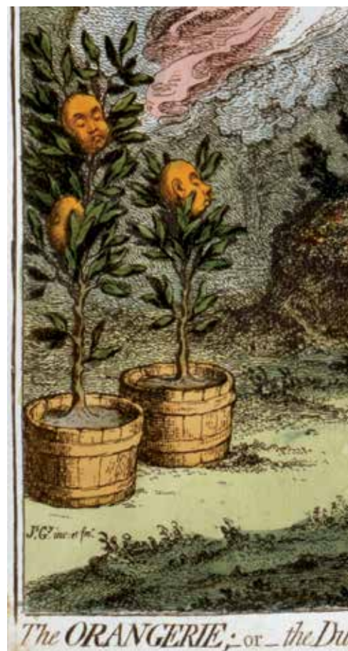
detail: Stadhouder Willem V tussen zijn oranjebomen 9