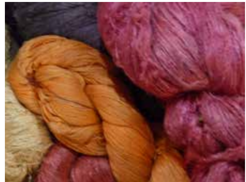
Zijde.