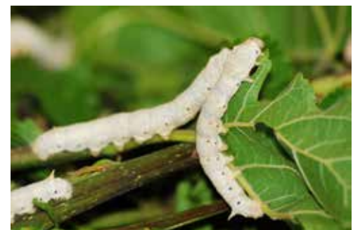
Zijderups, Bombyx mori .