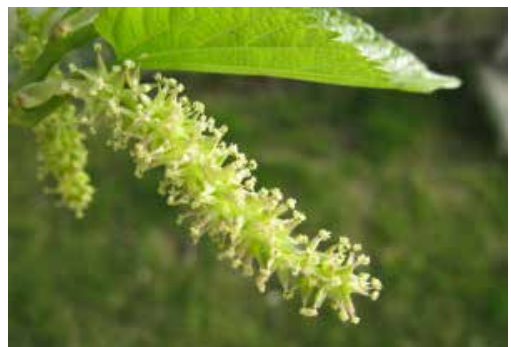
Morus alba , mannelijk katje.