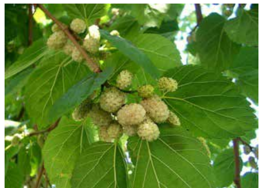
Morus alba , vruchten.

Het stamperkatje van de boom wordt tot 'vrucht', de moerbeï, doordat de bloemdekbladen vlezig worden en de droge vruchtjes omsluiten.