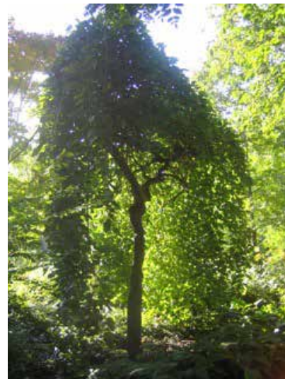
Morus alba 'Pendula' in het Arboretum

dezelfde boom. De boom is ofwel mannelijk ofwel vrouwelijk en uitzonderlijk eenhuizig. Sommigen wisselen zelfs van geslacht van het ene op het andere jaar. De Moerbeï is een windbestuiver. De mannelijke katjes produceren kleine stuifmeelkorrels die door de wind worden meegevoerd. Als extraatje lanceert de mannelijke bloem het stuifmeel ook nog eens met een enorme kracht. Door droging krimpen de meeldraden en wordt er veel elastische spanning opgebouwd. Wanneer de meeldraad breekt, worden de korrels gelanceerd met een enorme snelheid van wel 560 km/u. Nog niet eerder is bij een organisme zo'n hoge snelheid gemeten. In theorie zou een